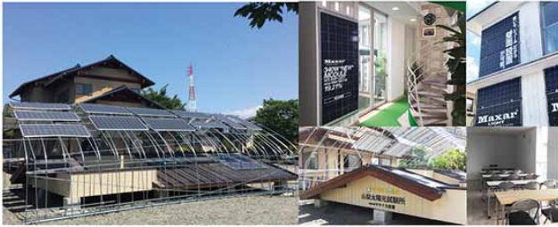
ビニールハウス設置から、各種屋根材、壁面設置まで数々の体験と研修が可能です。